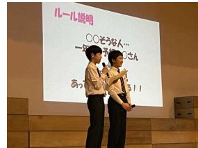
1年生からのクイズ