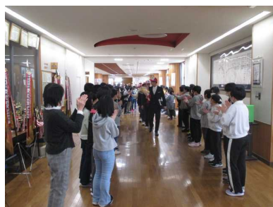
～5、6年生も見送りに参加～