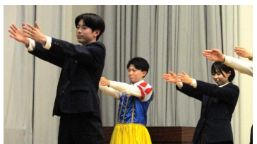
～3年生を送る会の様子～

2月25日(水)に、卒業生の入試(公立一次募集)激励会と3年生を送る会があり、1・2年生から心を込めた発表がありました。そして、3月6日(金)には、令和7年度卒業証書授与式を挙行し、卒業生31名は八郎瀧中学校での思い出を胸に元気に旅立ちました。一層の活躍を期待しています。