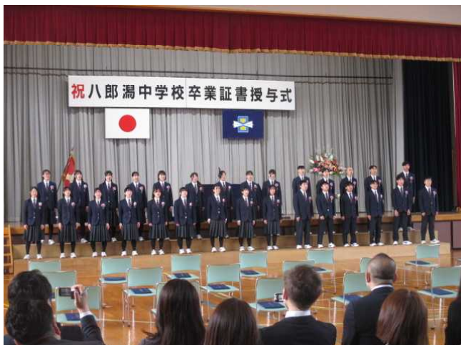
～卒業生合唱「旅立ちの日に…」～