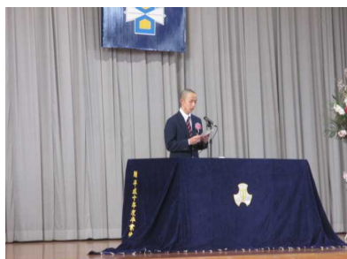
～答辞～ 卒業生代表 〇〇〇〇さん