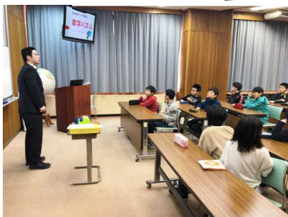
小中連携「算数」の授業

2月6日(木)小学6年生の児童31名を対象に、数学の「授業体験」が行われました。今回6年生が受けた授業は、4つの4を + - \times \div を使って1~10の答えを出す計算にチャレンジする内容でした。先生の話真剣に聞き、一生懸命考える6年生の姿が印象的でした。