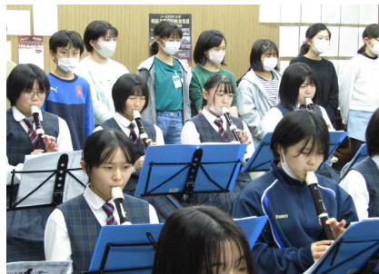
中学校3年生の音楽（アルトリコーダー）の授業を見学