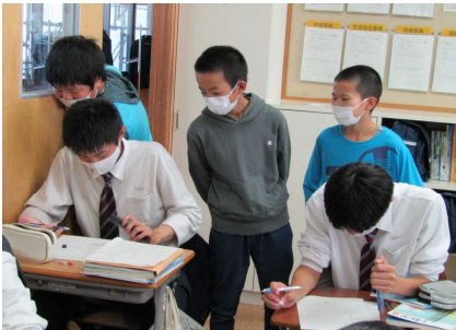
中学生がどのようにノートをとっているのか興味津々の6年生

10月14日（金）、6年生が八郎潟中学校の体験入学・部活動見学へ参加しました。中学校の授業見学（美術、数学、音楽）のあと、中学校生徒会による中学校生活の説明会に参加し、その後、部活動見学を行って中学生の学校生活について理解を深めました。6年生たちは、半年後に迫る中学校入学への期待を大きく膨らませているようでした。中学校での活躍が楽しみです。