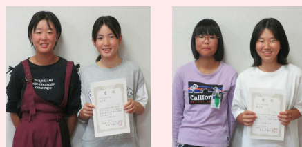
○○さん、○○さん ○○さん、○○さん