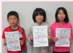
左から ○○さん ○○さん ○○さん