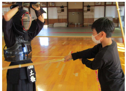
剣道部を見学し、竹刀の持ち方を習った後で、胴打ちを体験