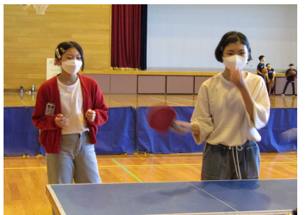
中学生を相手にして、卓球のラリーを楽しみました。