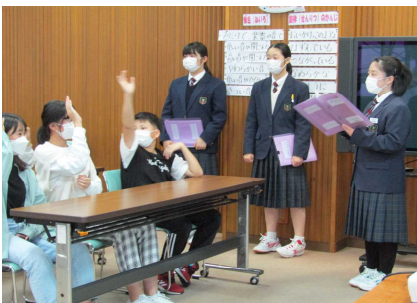
中学生の質問に元気に答える6年生。反応がとてもいいですね。