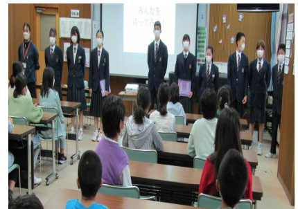
中学校生活についての説明をわくわくしながら聞きました。