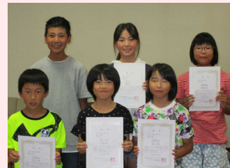
東北大会に出場するソフトテニスの6名