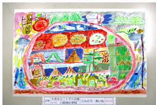
2年 〇〇 〇〇