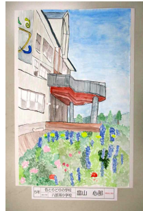
5年 〇〇 〇〇