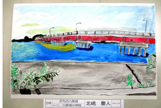
5年 〇〇 〇〇