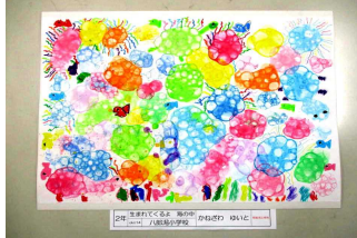
2年 〇〇 〇〇